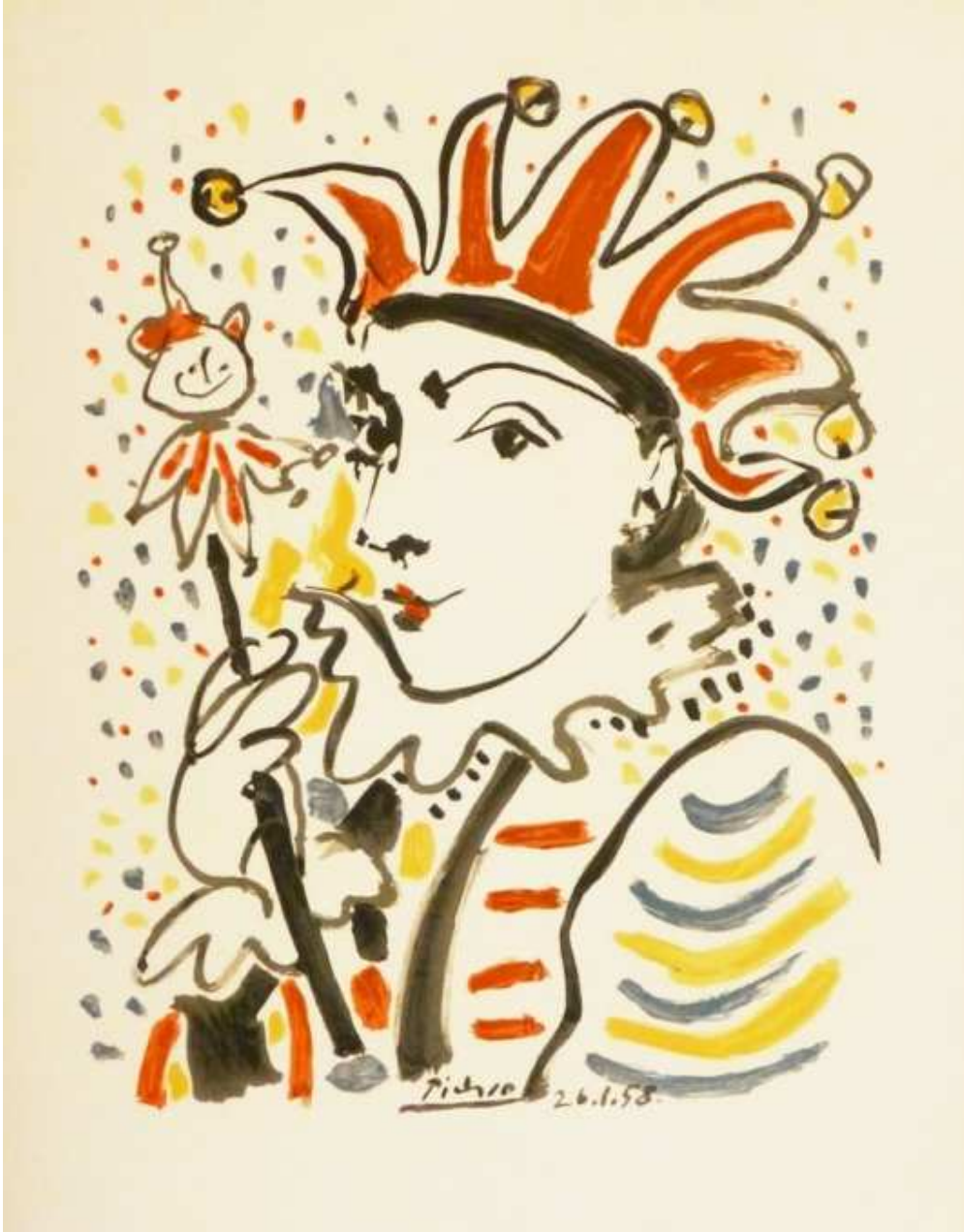
PABLO PICASSO - KARNEVAL - Farb-Lithographie auf Bütten 65 cm x 50 cm - GV001 - 26.01.1958