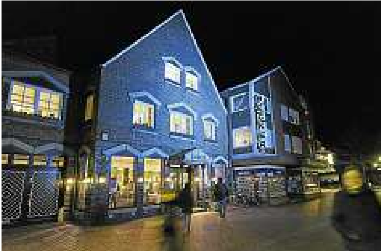
Richtig illuminiert stellt auch das Gebäude der Galerie van Almsick ein kleines Kunstwerk dar.

Ungerahmte Grafiken schlummern häufig in Mappen liegend in den Schubladen von Grafikschränken der nächsten Inaugenscheinnahme entgegen und warten nur darauf, endlich gezeigt zu werden.